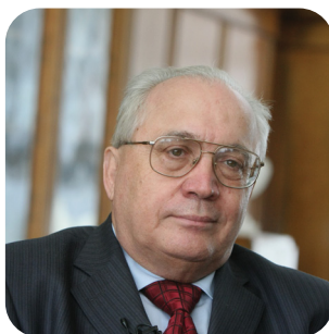
САДОВНИЧИЙ ВИКТОР АНТОНОВИЧ

президент Российского союза ректоров, ректор МГУ